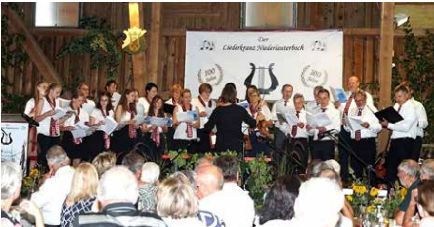
Unser Projektchor – eine große Bereicherung für den Liederkranz

Unsere zweite Feier: Am 20.7.2024 fand das große Fest unter dem Motto „100 Jahre Liederkranz Niederlauterbach“ statt. Schon Monate vorher haben wir uns Gedanken gemacht, wie dieses Jubiläum ablaufen soll. Und