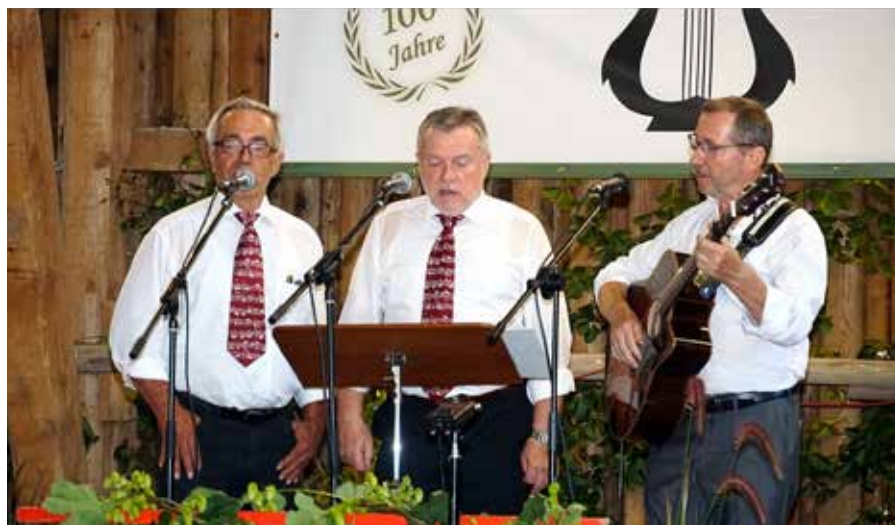
Best-of-Parodie – der vorletzte Auftritt

Unsere letzte Feier im Jahr 2024: Es war der zweite Original Lauterbacher Abend in diesem Jahr. Zum Abschluss unseres Jubiläums fand dieser Abend heuer am ersten Advent statt. Ein erster Versuch. Begonnen haben wir am Nachmittag schon um 13.30 Uhr. Und das Feuerwehrhaus in Rottenegg