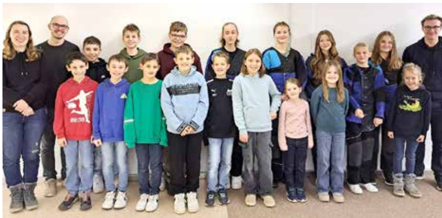
Licht- und Luftgewehr Schüler inklusive Trainerteam

Mit dieser Grundlage konnte unser Verein nach mehreren Jahren Pause für die Saison 2024/25 endlich wieder eine Schülermannschaft melden. Der Gau Hallertau hat erstmals die Disziplin Lichtgewehr bei den Rundenwettkämpfen eingeführt. Dieses Angebot haben wir gerne angenommen