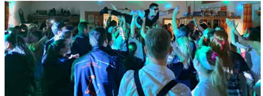
Faschingsball: Auch heuer wurde beim Faschingsball wieder ausgelassen gefeiert.

den Ball mit einem Walzer. Die Geisenfelder Faschingsgesellschaft zeigte bei einem atemberaubenden Auftritt ihr Können. Danach wurden die besten Masken prämiert, wobei die Auswahl unter den vielen fantasievollen Verkleidungen schwer war. Bei ausgelassener Stimmung wurde bis in die frühen Morgenstunden gefeiert.