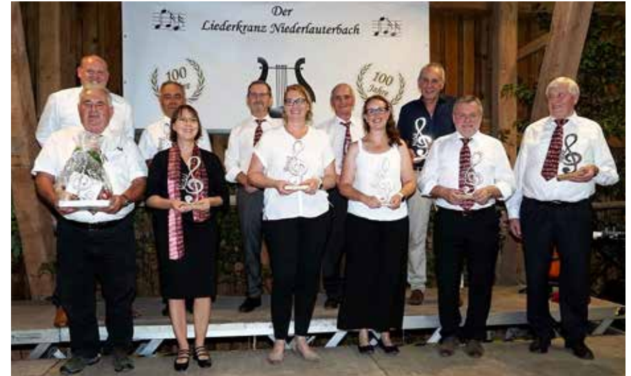
Der Liederkranz zeichnet langjährige Sänger und „tragende Stützen“ aus.

dann verging alles wie im Flug. Am Mittwoch vorher trafen wir uns, um die Halle bei Engelbert Schretzlmeier in Oberlauterbach fertig herzurichten. Am Freitag war dann die Generalprobe und am Samstag stieg das große Fest. Und was für ein Fest! Alles war top organisiert worden. Die Halle war sehr schön feierlich und überaus würdig hergerichtet. Ab 15.00 Uhr füllten sich dann allmählich die Bierbänke und eine halbe Stunde später waren alle Bänke auch gut besetzt. Die Besucher waren angetan von dem abwechslungsreichen Programm. Zitat einer Besucherin: „Mei, hob i heid an schena Nachmittag erlebt!“ In den Pausen spielten die Bruchpiloten mächtig auf. Die Versorgung mit Kaffee und Kuchen, mit kühlen Getränken und in der zweiten Pause mit einem leckeren gemischten Braten lief völlig reibungslos ab. Das geht halt nur, wenn viele Hände zusammenhelfen. Hier haben die zahlreich beteiligten Vereine ganze Arbeit geleistet. Vielen Dank für eure wunderbare Unterstützung. Nach dem offiziellen Ende gegen 20.15 Uhr spielte die „Lang-Band“ noch kräftig auf. Schluss war