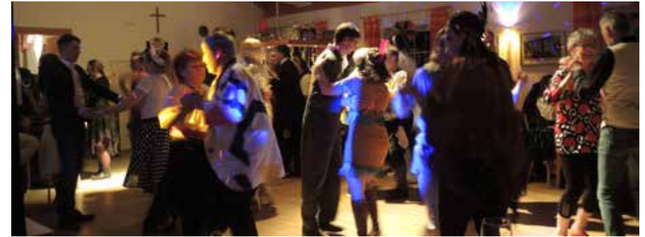
Tanzfläche: Mit vielen fantasievollen Verkleidungen wurde bis in den Morgen getanzt.

den Ball mit einem Walzer. Die Geisenfelder Faschingsgesellschaft zeigte bei einem atemberaubenden Auftritt ihr Können. Danach wurden die besten Masken prämiert, wobei die Auswahl unter den vielen fantasievollen Verkleidungen schwer war. Bei ausgelassener Stimmung wurde bis in die frühen Morgenstunden gefeiert.